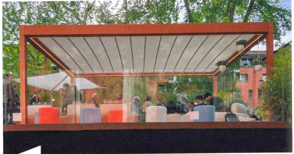
Mit der perfekten Optik der Alba Butterfly erregte Corradi viel Aufsehen in Mailand.

„Als fester Termin im Herzen von Corradi ist die Milano Design Week für uns ein einzigartiger Moment für Austausch und Dialog. Auch hier woll-