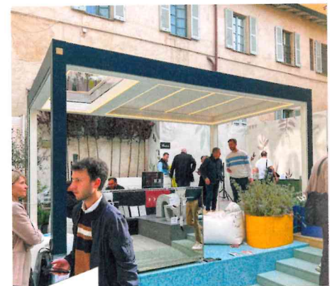
Mit gleich zwei Imagos in unterschiedlichen Versionen war man am Piazza San Marco in Brera vertreten.

Im dOT-Bereich mit dem diesjährigen Motto „Materia Natura“ präsentiert Corradi seine innovativen Produkte am Piazza San Marco.